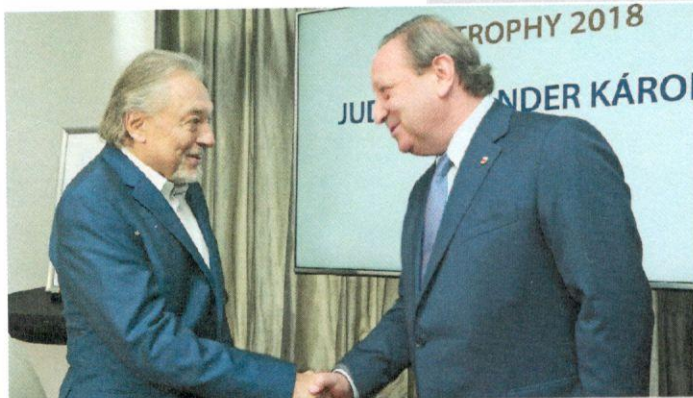
K vysokému vyznamenaniu od Medzinárodného olympijského výboru prišiel osobne Alexandrovi Károlyimu gratulovať jeho dlhoročný priateľ, pán Karel Gott.

Aký odkaz zanecháte pre občanov vašej rodnej obce, ktorá sa okrem skrášľovania a rozvoja podieľa aj na podpore kultúrno-spoločenského a športového života ako i zvyšovania kvality života